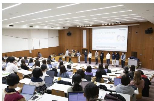
地域包括ケア論 I / II : 第1・2学年合同発表会

上述の各学問領域の実習を積み重ねた後に、自分の関心のある領域で総合実習を行い、看護に関する理解を深め、実践能力を向上させます。さらに卒業研究では、看護に関して特に興味・関心の深い研究テーマを見出し、研究活動の基本を学びます。