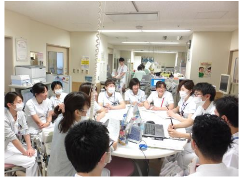
病棟・多職種カンファレンス

大学病院勤務となった看護職員に対する教育・研修制度が完備し、育児休業・育児短時間勤務制度等の福利厚生も充実しています。