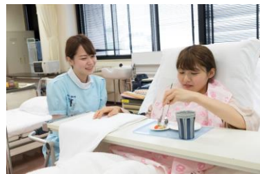
高齢者看護学演習

そのような人々を理解し、看護を提供するには、看護師自身の人間としての成長が不可欠です。具体的には、人の悲しみ・苦しみ分かる、そのような人の側に寄り添える、成熟した人間となることが期待されています。学生は、教養教育や自ら主体的に学ぶ習慣を修得し、生涯にわたって自己を高めていくことが求められています。