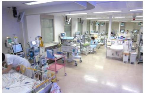
NICU：新生児集中治療管理室