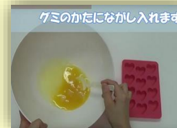
グミのかたにながし入れます