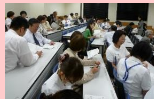
「ワークショップの様子」