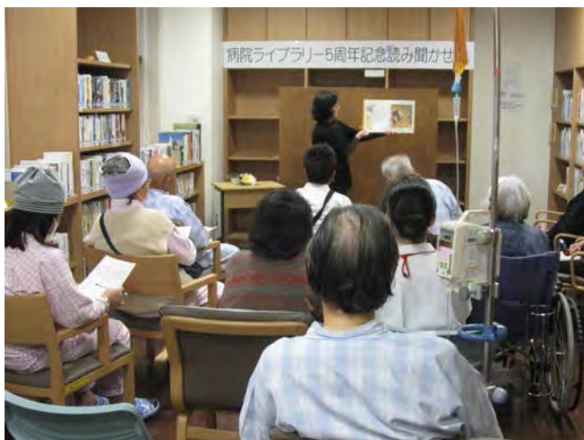
「だいくとおにろく」