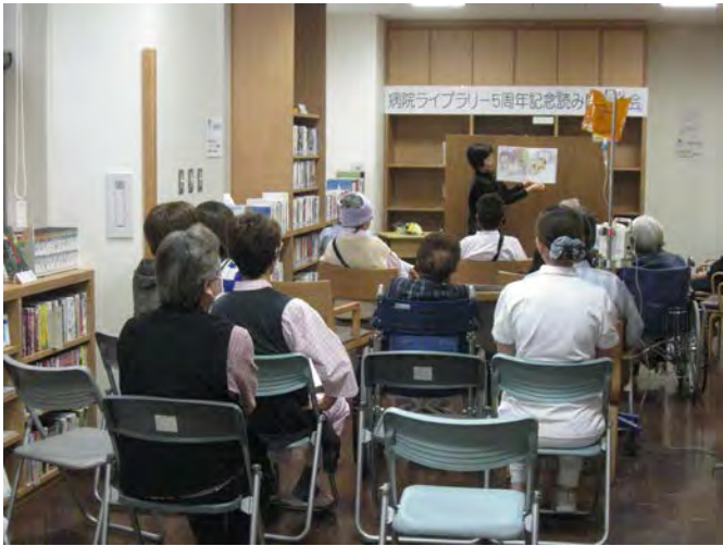
「としゃかんライオン」