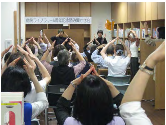
てあそびをみんな一緒に！