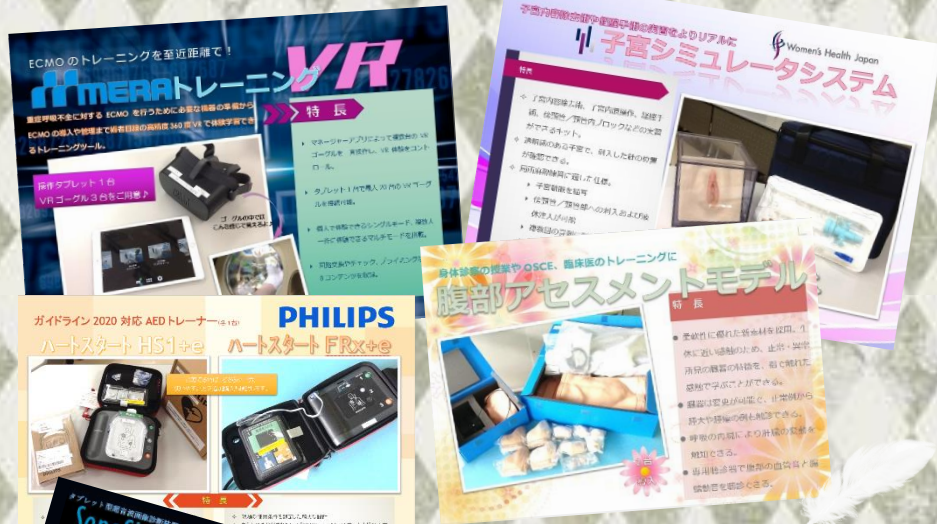
※これらのポスターは一部です。

2022年2月～3月に新しくシミュレータ等を導入しました！センター内ではポスターを掲示してご紹介しています。ぜひ覗きにいらしてくださいね♪