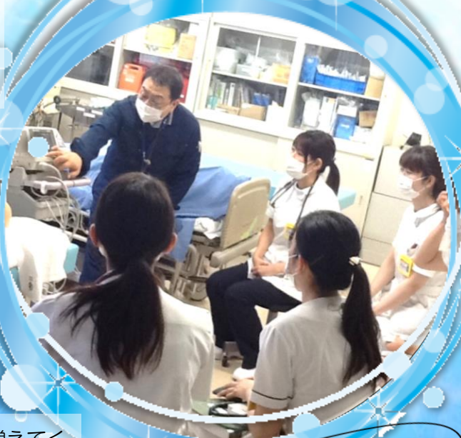
救急科のBSL実習の様子

CSCとしても衛生面に気を配り、利用される方々が気持ちよく研修や実習に取り組めるよう、協力をしていこうと思います。