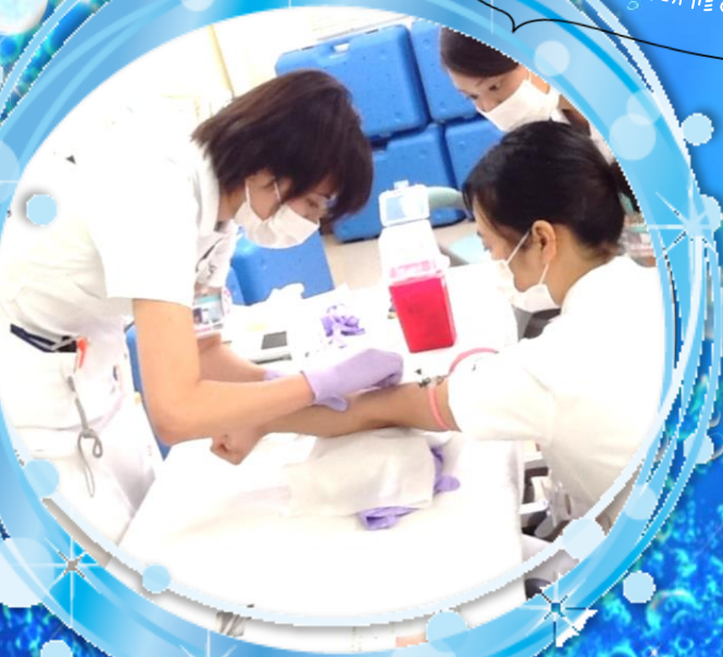
看護部の技術研修の様子