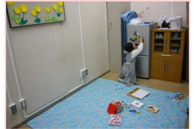
病児お預かり中の様子 マグネット遊びに夢中です!